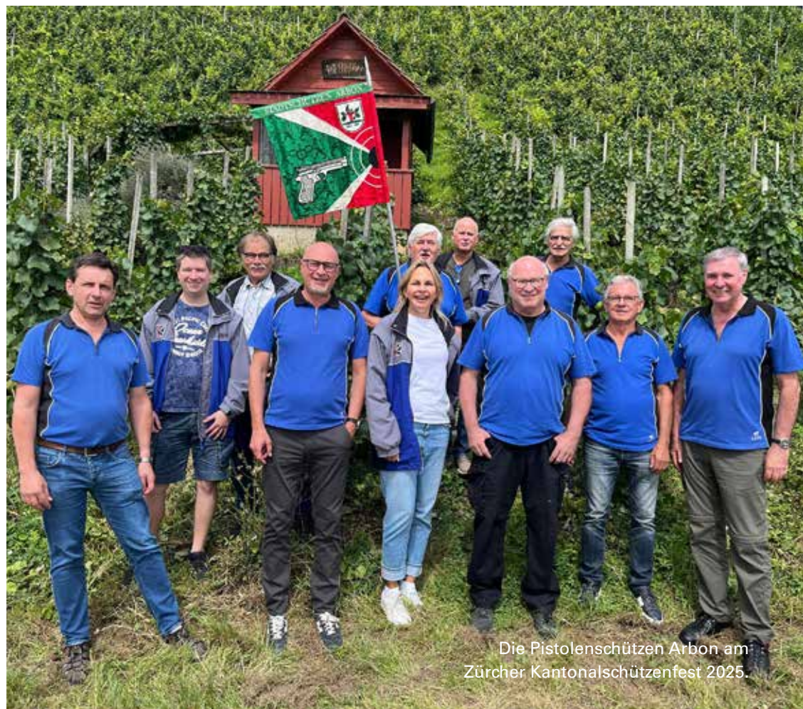
Die Pistolenschützen Arbon am Zürcher Kantonal-schützenfest 2025.

Während des Anlasses nicht bezogene Auszahlungen verfallen zu Gunsten des Organisations.