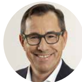
René Walther Stadtpräsident Arbon

Freitag 1. Mai 2026 13.30 bis 18.30 Uhr Samstag 2. Mai 2026 9 bis 12 Uhr 13.30 bis 17 Uhr Samstag 9. Mai 2026 9 bis 12 Uhr 13.30 bis 17 Uhr Sonntag 10. Mai 2026 9 bis 12 Uhr