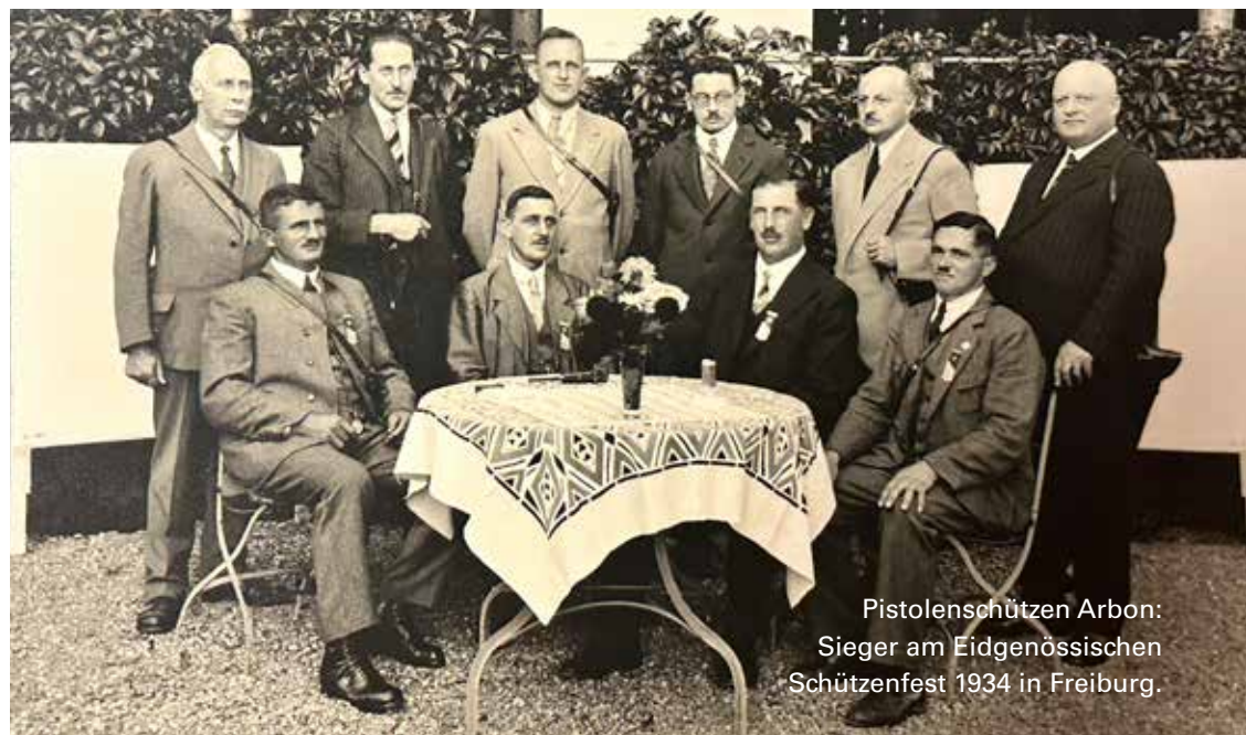
Pistolenschützen Arbon: Sieger am Eidgenössischen Schützenfest 1934 in Freiburg.